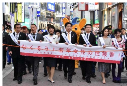
【啓発街頭キャンペーンの様子】